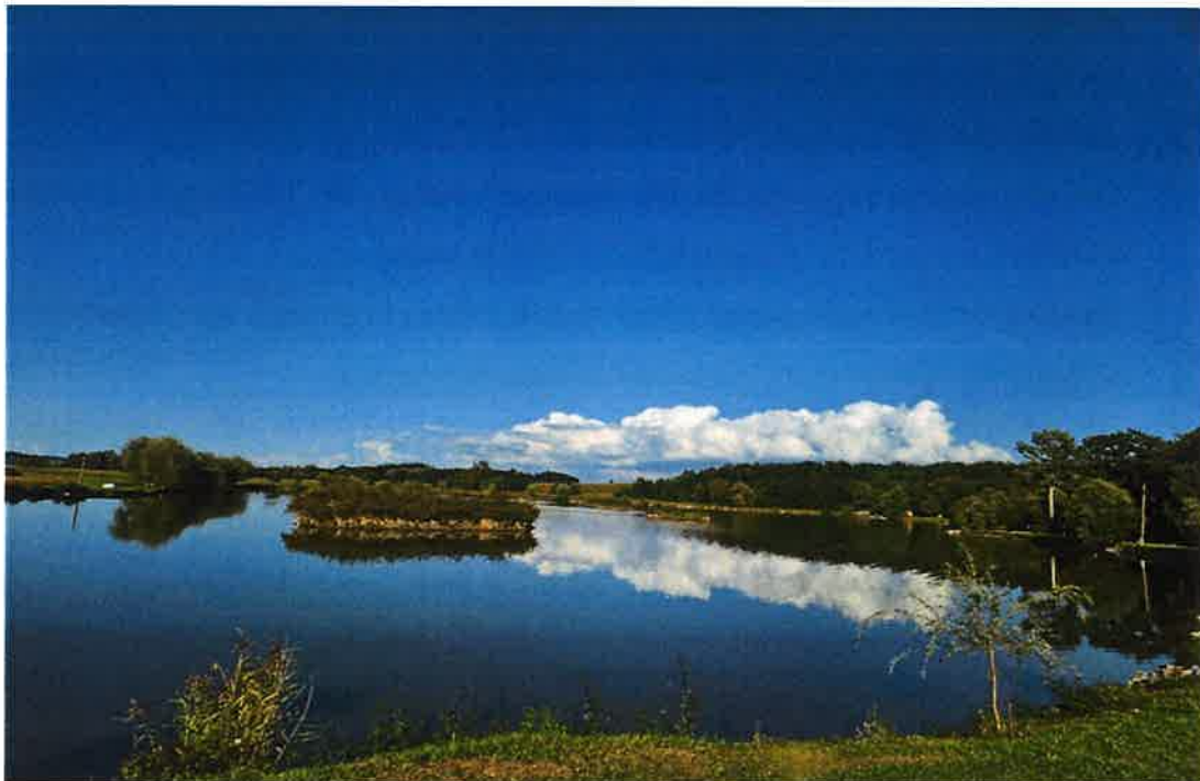
Slika 3: Ribnjak u Općini Severin

Posebno se ističe ribnjak Športsko-ribolovnog društva „Slavija“ površine 5,5 ha, koji uz rješavanje imovinsko-pravnih odnosa ima veliki potencijal za uređenje ribarske kuće s konferencijskom dvoranom i smještajnim kapacitetima. Takav projekt doprinio bi jačanju turističke ponude i stvaranju novih sadržaja za posjetitelje.