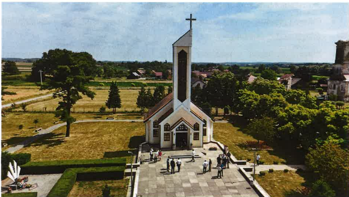
Slika 1: Općina Severin

Obuhvaća područje dvaju naselja: Orovac i Severin. Granice općine određene su katastarskim granicama rubnih naselja, a promjene granica moguće su samo na način i po postupku propisanom zakonom.